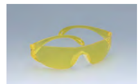
保護眼鏡(イルミスキャン用)